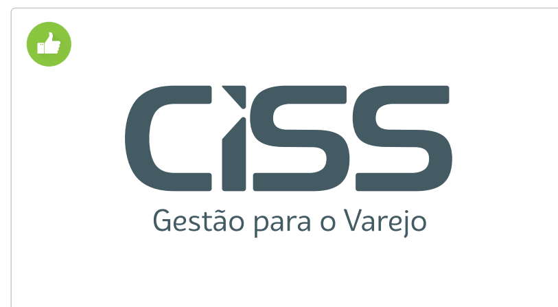
Logotipo com apenas uma coloração.