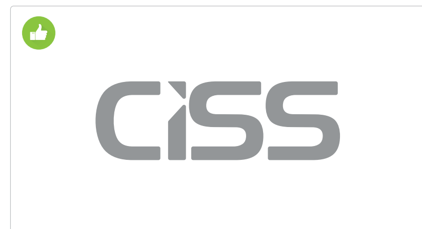
Logotipo em cores neutras.